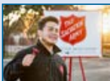
Chính quyền địa phương