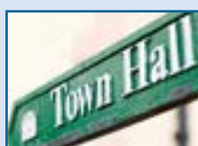
Các cơ quan từ thiện đặc biệt

Nếu bạn là người lớn (trên 18) bạn sẽ phải đưa ra sự đồng ý để được giới thiệu vào Cơ chế Nạn nhân của nạn buôn người (NRM). Khi đồng ý để giới thiệu vào cơ chế NRM, bạn cũng đồng ý rằng thông tin của bạn sẽ được chia sẻ với các cơ quan của Bộ Nội vụ và Cảnh sát. Bạn không cần phải trình báo cho cảnh sát, nhưng họ có thể liên lạc với bạn và hỏi nếu bạn muốn hỗ trợ làm việc đó hay không.